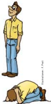
Illustrationen: F. Prati

Der Hund verliert das Interesse an einer Person, die still und unbeweglich ist und entfernt sich. Jede Bewegung hingegen zieht seine Aufmerksamkeit an.